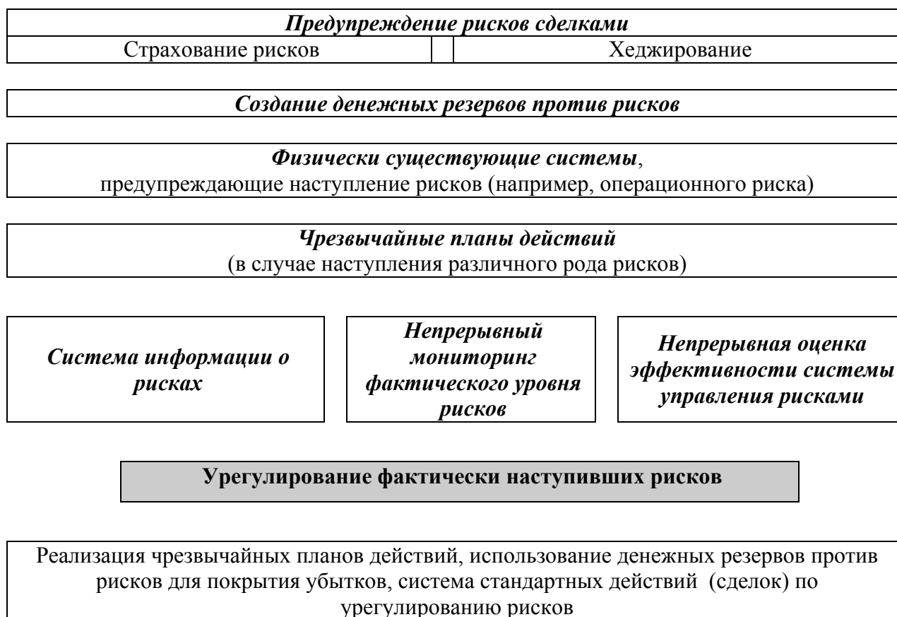
Рис. 3 – Система управления рисками, связанными с реализацией проектов частно-государственного партнерства в вузе

Для управления рисками ЧГП вуз должен утвердить в документированной форме стратегию управления рисками ЧГП (см. рисунок 3 ), определяющую: