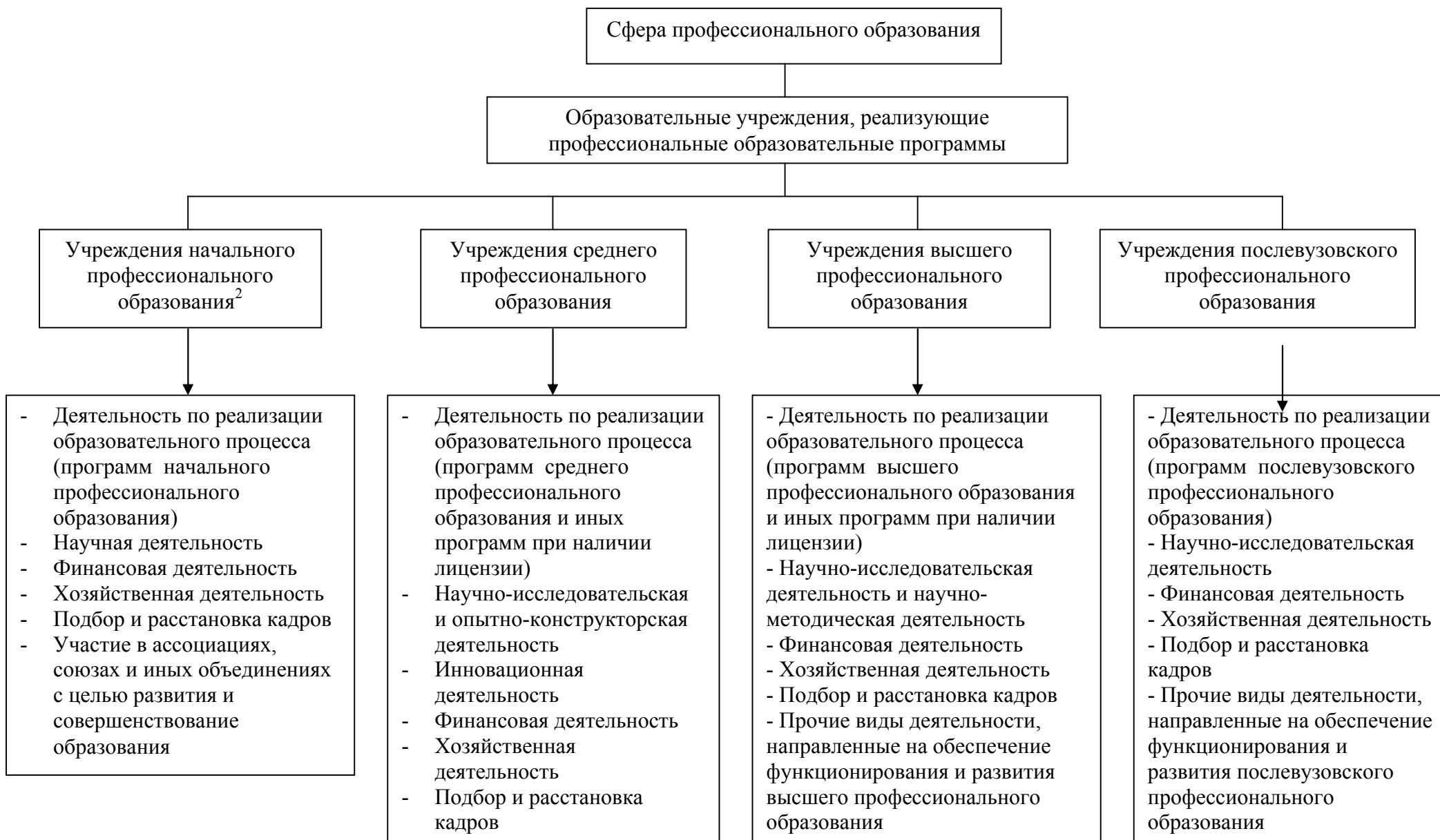
Рис. 1 – Структура сферы профессионального образования, относительно которой разрабатываются формы и механизмы частно-государственного партнерства